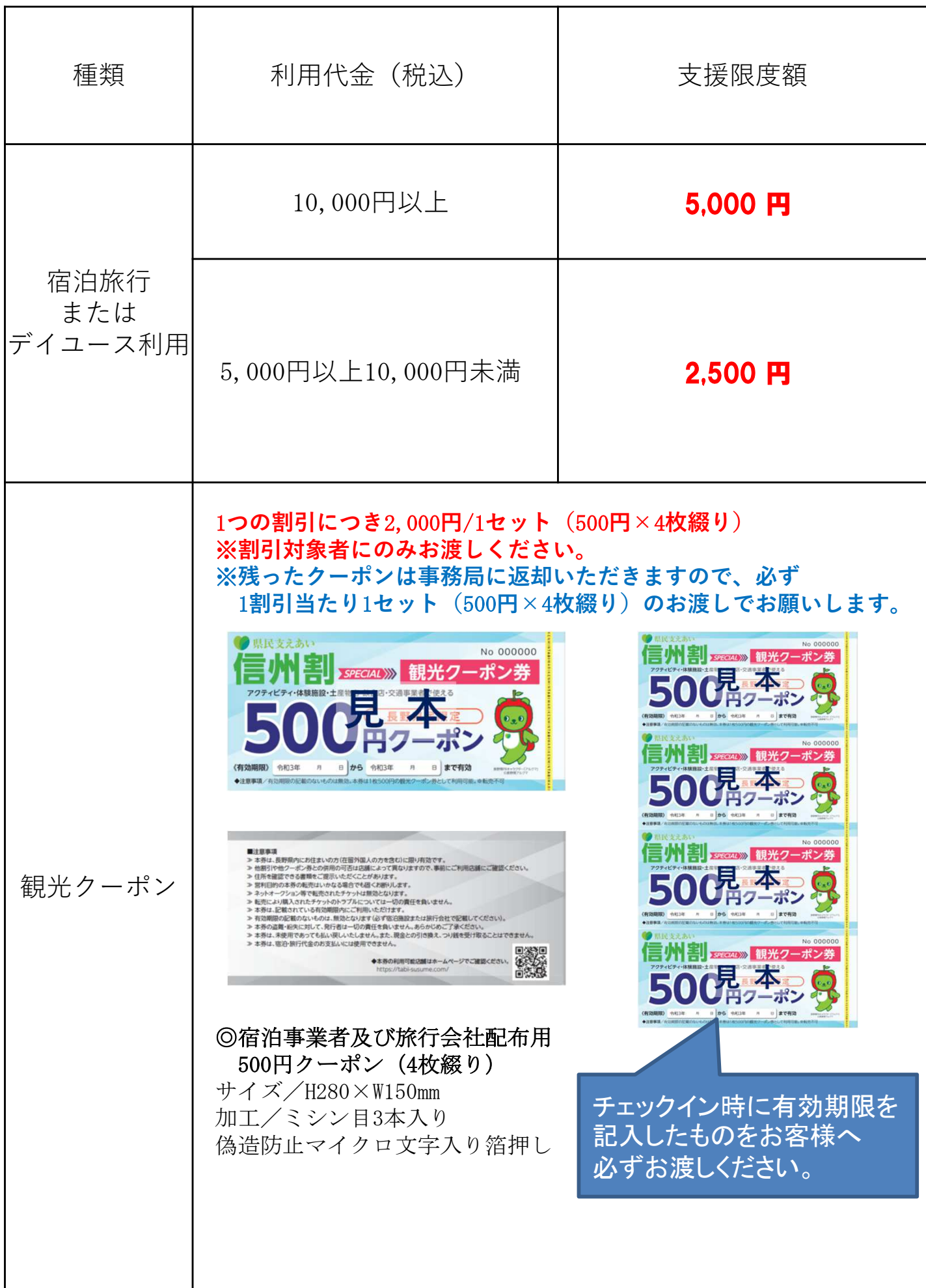
表1 1人1泊または1利用あたりの支援額（割引額）早見表